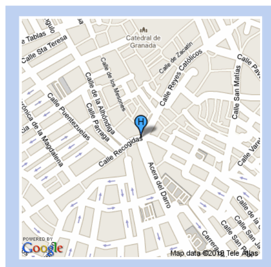
Puerta Real, 3, Granada (España)

Situado en pleno centro histórico y comercial, el hotel NH Victoria está a pocos minutos de los principales puntos de interés de la ciudad, como el Ayuntamiento, la Catedral, el Palacio de Congresos o la maravillosa Alhambra, símbolo inequívoco de la Andalucía mestiza. Un magnífico emplazamiento que hará de su visita a Granada una experiencia difícil de olvidar. El hotel NH Victoria constituye un edificio histórico y emblemático de la ciudad cuya construcción data de finales del siglo XIX, de la cual se conserva su magnífica fachada. Actualmente, el hotel ha sido reformado para el mejor disfrute y confort de sus clientes llegando a ser catalogado dentro de la gama Collection de NH. Sienta la atmósfera especial que envuelve el NH Victoria. Disfrute de la majestuosidad de su magna construcción y de sus estancias luminosas y cálidas con la decoración sobria, actual y elegante que define el estilo NH. Nº de registro: H/GR/01287